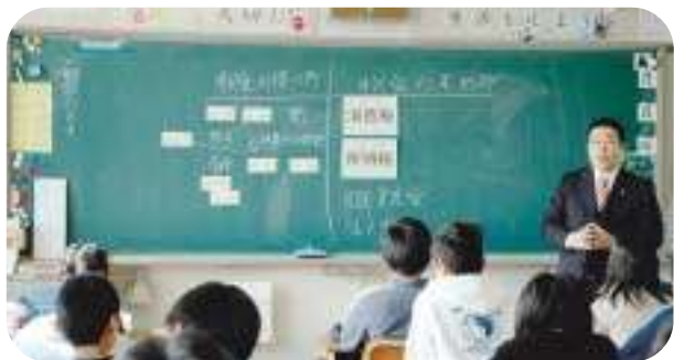
H19.1.25 / 租税教室