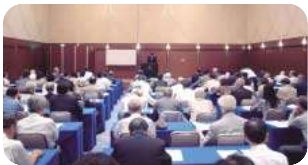
H19.6.20 / 支部研修