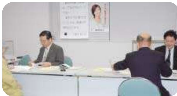
平成18年度確定申告