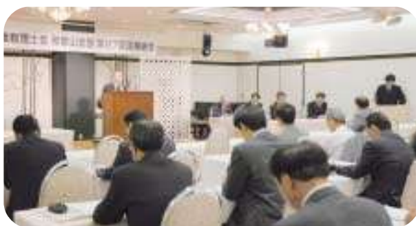
H19.5.11 / 第27回定期総会