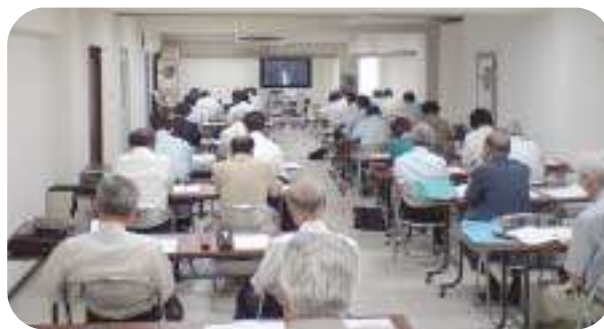
H19.7.3 / 支部ビデオ研修